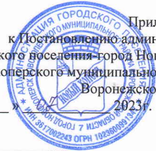
Схема границ прилегающей территории городского поселения-город Новохоперск Новохопёрского муниципального района Воронежской области

Приложение 1 к Постановлению администрации городского поселения-город Новохоперск Новохоперского муниципального района Воронежской области от « 13 » _____ 2023г. № 159